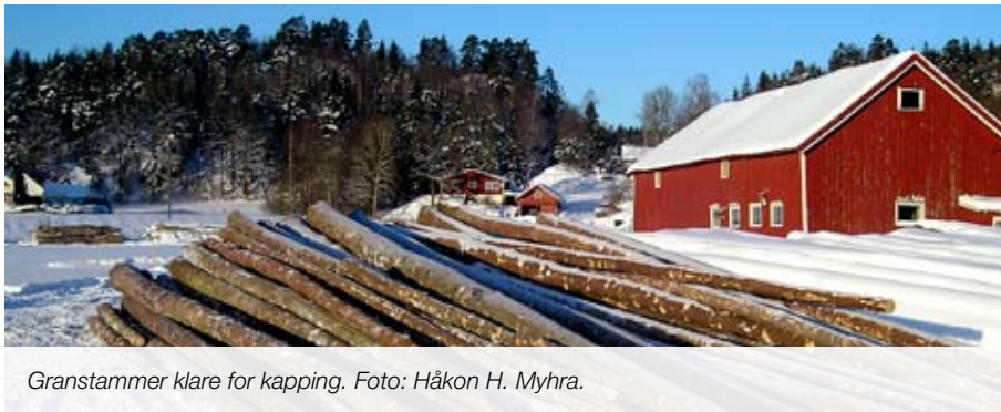
Granstammer klare for kapping.

Prisene til de største kjøperne har økt med 10-15 kr/m 3 for sagtømmer og 15-30 kr/m 3 for massevirke fra nyttår. Økte priser og god avsetning gir grunnlag for økt avvirkning og aktivitet i skogen. I tillegg kommer mulighet for kontraktstillegg på 15 kr/m 3 og tynnings-tillegg på 20 kr/m 3 .