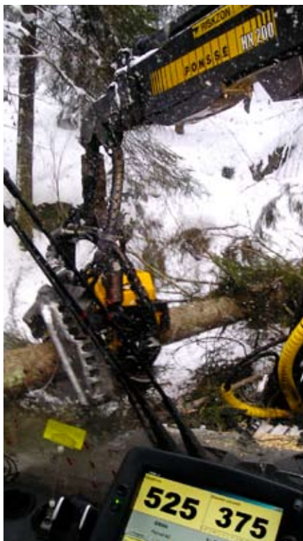
Ponsse hogstmaskin i full sving med driftsoppdrag på 2 000 m 3 på Vegårshei.

- Burde vel vært skiftet ut, men da skulle jeg gjerne hatt opp tømmerprisene litt. Klar tale fra en erfaren skogsarbeider på Vegårsheia.